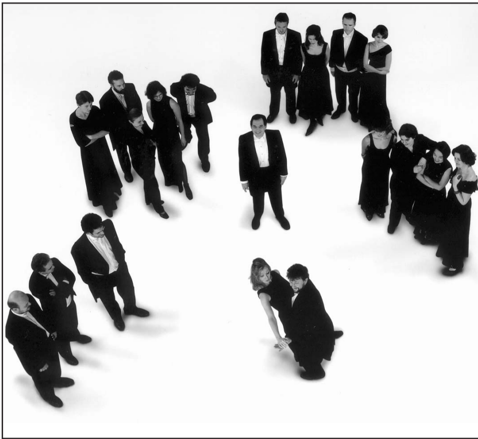
In der griechischen Haupt- und Olympiastadt ist die Kamerala Athen ein Mittelpunkt des Musiklebens. Heute spielt sie Schubert, Schönberg und Bach (Violinkonzert a-Moll BWV 1041).