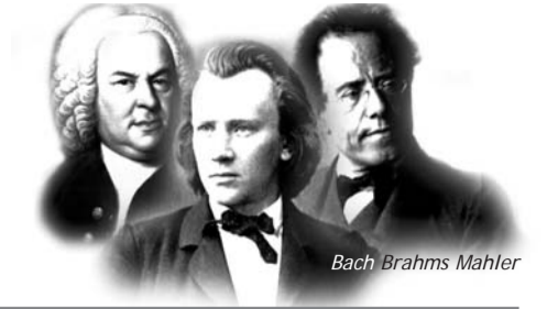
Bach Brahms Mahler

Europäisches Musikfest Stuttgart 23.8. - 7.9.2003 / Ausgabe Donnerstag, 4.9.2003